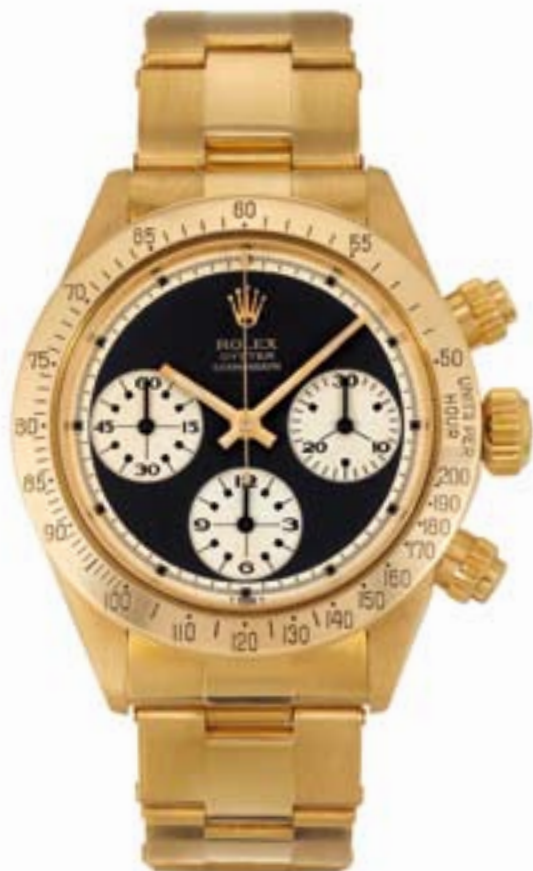
REF. 6265/8 QUADRANTE "NEWMAN"

Diciamo subito agli appassionati, ai collezionisti e ai commercianti di Submariner, che con questo volume potranno ritenersi soddisfatti. Grazie infatti a una documentata e meticolosa ricerca (durata oltre 4 anni), gli autori riescono a costruire la storia e una conoscenza "enciclopedica" su tutti i modelli Submariner moderni e d'epoca.