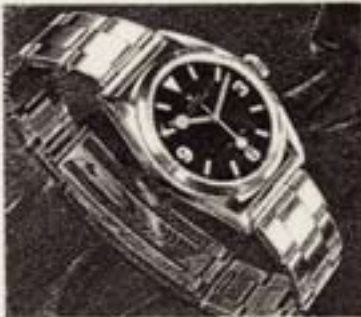
THE ROLEX CAPSTONE is an anti-shock, anti-magnetic and anti-radiation time-measuring instrument. The famous Oyster Perpetual case has been strengthened to stand up to tremendous pressures. The Capstone is waterproof to a depth of 300 feet under water and to a height of 17 miles. It is wound automatically by the unique Rolex Perpetual self-winding " rotor " which, by turning on every motion of the handgrip, causes the rotor to rotate. The Capstone is anti-magnetic; it has nearly limitless vital reserves on a single 31-day 30,000 P.P.H. battery, including the case bracelet.

In front view, all Rolex Oyster Perpetuals are graded by the new, famous Oyster case. This unique invention effectively protects the movement against water, dust and shock. It is guaranteed to withstand temperatures from 57° F to 207° F (-17° C to 137° C) and to resist pressure to a depth of 130 feet (30 metres) under water.