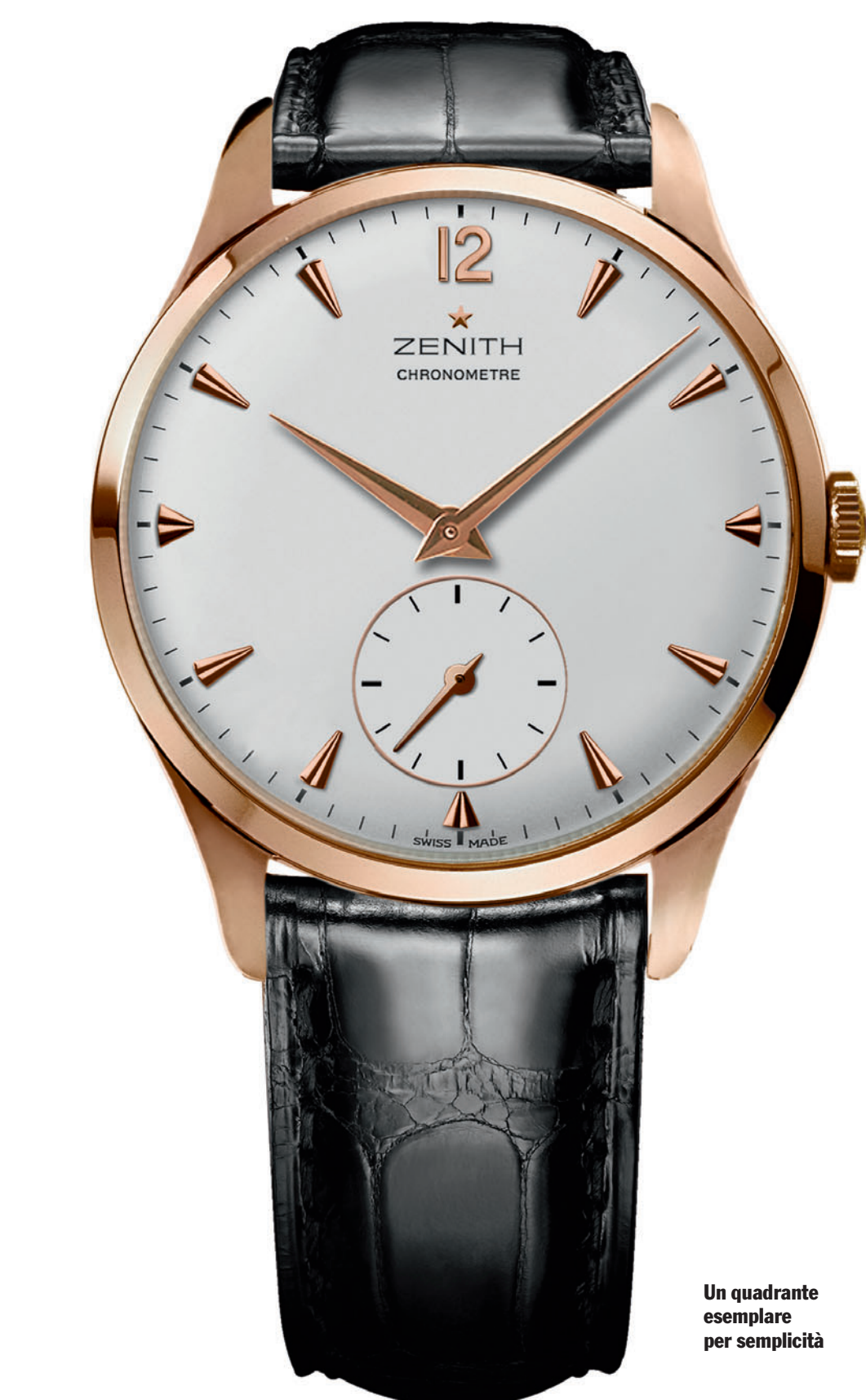
Un quadrante esemplare per semplicità

Si chiama DSide questo orologio di una storica linea che la Maison ha realizzato, insieme con una collezione di gioielli, in collaborazione con l'attore Brad Pitt. La cassa è in acciaio (ma c'è anche la versione in oro giallo) ed è caratterizzata dal motivo a due anelli concentrici tra i quali sono incastonati 5 diamanti, che sono il motivo ricorrente di tutta la collezione. L'orologio ha movimento al quarzo ed è corredato da un cinturino in cocodrillo sempre abbinato al colore del quadrante. Prezzi a partire da 1.050 euro.